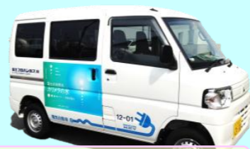
電気自動車でお家で運んでいます!