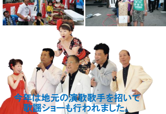
今年では地元の演歌歌手を招いて 歌謡ショーも行われました。