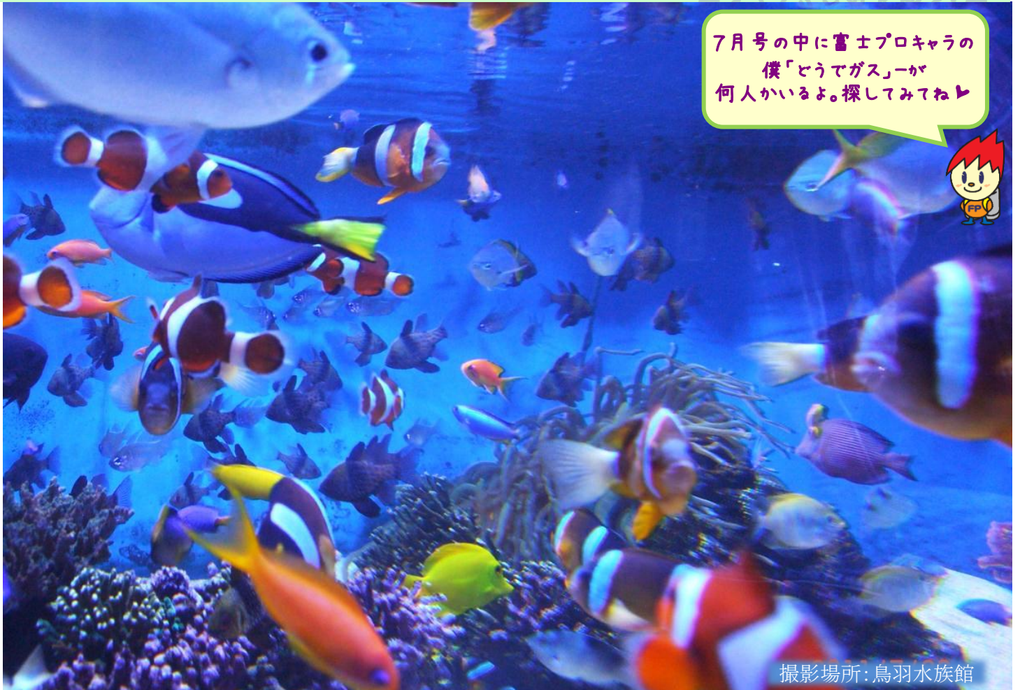
撮影場所:鳥羽水族館