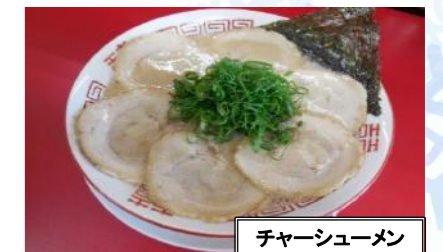
チャーシューメン

TEL(0566)-98-1620 定休日:不定休 安城市宇頭茶屋町大浜屋敷39 昼/月～金 11:30～14:00 土日 10:00～14:30 夜/月～金 18:00～ 土日 17:00～ ※スープ終了まで