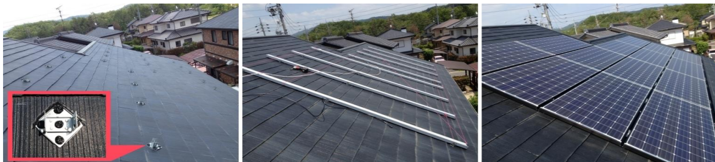
専用金具で基礎作り