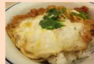
「王道やわらかかつ丼」