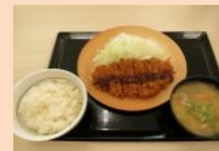
「サクサクとんかつ定食」